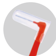
携帯用キャップ付